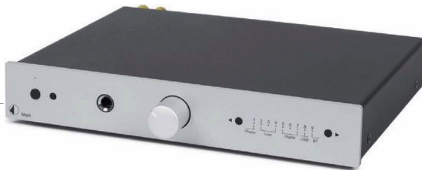
HAT'S IM RÜCKEN: Die Entwickler des MaiA nutzten jeden Winkel aus, um die vielen Anschlüsse unterzubringen. Bei einem der Analog-Eingänge reichte es nur zur Mini-Klinke.