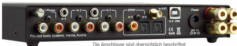
Die Anschlüsse sind übersichtlich beschriftet. Praktisch, da es davon eine ganze Menge gibt