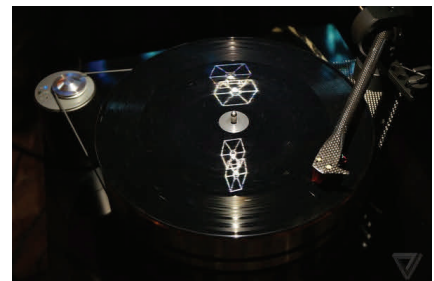
Tie Fighter und Millennium Falke Hologram