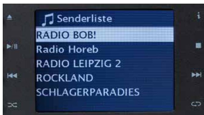
Im Suchlauf gefundene Radiostationen werden in einer alphabetisch sortierten Senderliste abgelegt und können von dort auch abgerufen werden