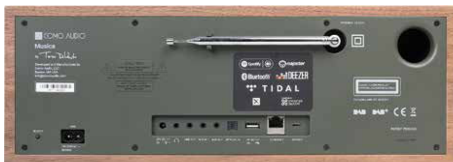
Kaum Mangel gibt es bei den Anschlüssen. Neben analogen Quellen lassen sich über den optischen Eingang sogar digitale Tonsignale zuspielden