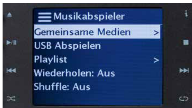
Über den Musikabspieler lassen sich neben USB-Medien auch Musikstücke aus dem heimischen Netzwerk abspielen