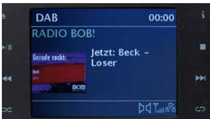
Natürlich wertet das Musica die mitgesendeten Radioinformationen aus und zeigt Grafiken sowie Radiotext an