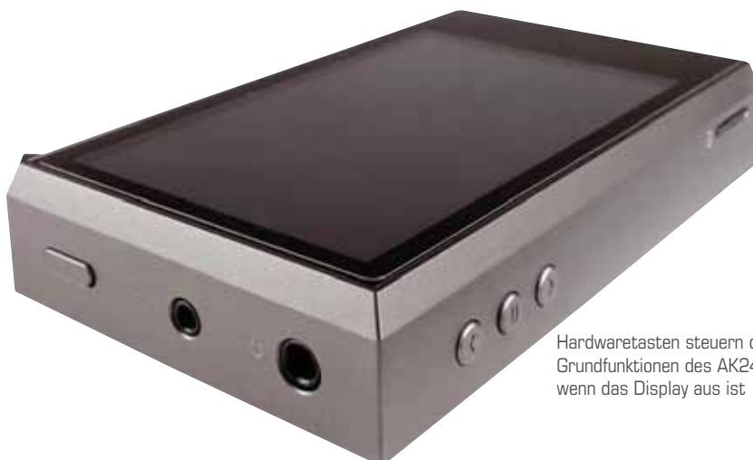
Hardwaretasten steuern die Grundfunktionen des AK240, wenn das Display aus ist

Endlich. Endlich gibt es einen Player, der höchstwertige Signalverarbeitung zu bieten hat und sich genauso flüssig und komfortabel bedienen lässt wie beispielsweise ein iPod Touch oder ein modernes Smartphone. Ermöglicht wird das durch ein auf Android basiertes Betriebssystem, das auf reine Audio-Funktionen gestutzt wurde und dank des flotten AMOLED-Bildschirms und des flotten Prozessors ein exzellentes und intuitives Bedienen