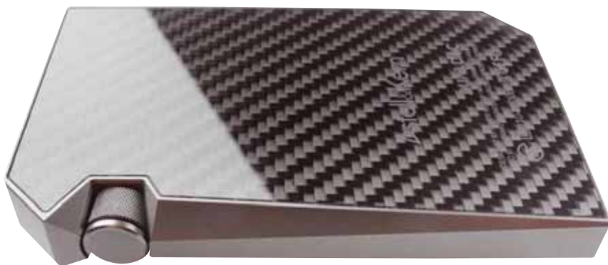
Ein traumhaft hübscher Carbon-Rücken zieht den AK240. Gut zu erkennen ist hier auch die extravagante Form

die auf dem Player installierte Musik ganz bequem und in maximaler Qualität durch die Luft schicken. Das ist natürlich praktisch und komfortabel und macht sich gerade im Auto sehr gut. Und um jetzt noch einen obendrauf zu setzen, kann man diese Universalwaffe im heimischen WLAN sogar als Streaming-Client einsetzen und Musik von einem Computer streamen und, sauber vom AK240-DAC gewandelt, über seine HiFi-Anlage wiedergeben. Dafür braucht man eine proprietäre Serversoftware (die man einfach von der iRiver-Seite für Mac und PC herunterladen kann) und hat dann einen wahnsinnig guten Streamer im Kompaktformat. Den Vorteil proprietärer Lösungen merkt man recht schnell: