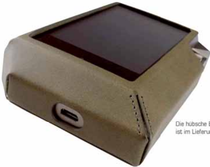
Die hübsche Echtledertasche ist im Lieferumfang enthalten

ermöglicht. Durch die hohe Auflösung von 480 mal 800 Pixeln sehen Cover und Schriften gestochen scharf aus und machen die exzellente optische Präsentation perfekt. Da macht es richtig Spaß, lässig über den Bildschirm zu wischen, um durch seine Albenlisten zu scrollen. Die wichtigsten Bedienelemente sind auch angenehm groß, so dass auch HiFi-Freunde mit großen Händen immer das richtige Icon treffen. Während der Wiedergabe, auch wenn der Bildschirm in den Standby-Modus geht, hat man immer noch die Möglichkeit, wichtige Funktionen wie Titelsprung und Pause per Hardware-Tasten an der linken Seite vorzuneh-