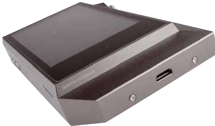
Die Micro-USB-Buchse ist zum Laden des Akkus und zum Synchronisieren der Inhalte da. Außerdem stellt sie eine vollwertige USB-Audio-Schnittstelle dar

Die dritte Möglichkeit, die klanglichen Vorzüge eines AK240 an der heimischen Anlage zu erleben, ist übrigens Streaming. Wer's einfach haben möchte und einen Bluetooth-Adapter mit seiner Anlage verbunden hat, kann