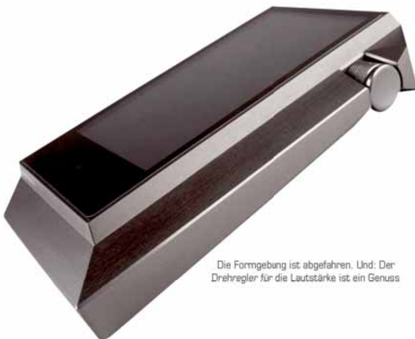
Die Formgebung ist abgefahren. Und: Der Drehregler für die Lautstärke ist ein Genuss

Was soll ich sagen: Das ist der beste mobile Player, den ich bisher in den Händen halten durfte. Hier stimmen Design, Bedienung und Klang in einem Maße, das ich schlicht noch