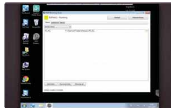
Wer die Serversoftware MGS installiert, kann seine Musiksammlung vom Computer per WLAN auf den AK240 streamen