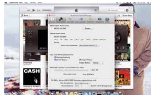
Volles Programm: PCM-Abtastraten bis 384 kHz sowie DSD und Double-DSD werden über die USB-Schnittstelle unterstützt