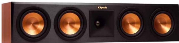
Insgesamt vier Tiefmitteltöner und ein Tractrix-Horn sorgen auch im Center-Speaker RP-450C für praktisch grenzenlose Dynamik