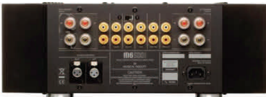
Was das Foto nicht zeigt: Alle Anschlüsse des Musical Fidelity sind matt vergoldet, was extrem wertig und edel wirkt. Die Lautsprecherklemmen-Paare sind nicht wie üblich nach Paar A und B schaltbar, sondern permanent parallel verfügbar, etwa für Bi-Wiring-Verkabelung.

Wer bei einer „Wuchtbrumme“ wie dem M6 500i einen großklotzigen Sound erwartet, den belehrt dieser Amp eines Besseren. Er spielt feinfühlig und ausbalanciert, bietet einen herrlich tiefen Raum und konnte bei den feinen Texturen substantielle Körperlichkeit darstellen wie keiner seiner Testgegner. So gelang es ihm, den Flügel des Jazz-Pianisten Nik Bärtsch (wir hörten das Album „Holon“) physisch greifbar im dem Hörraum zu platzieren. Nur an wenigen Stellen stellte er Stimmen oder Instrumente eine Winzigkeit größer dar als natürlich.