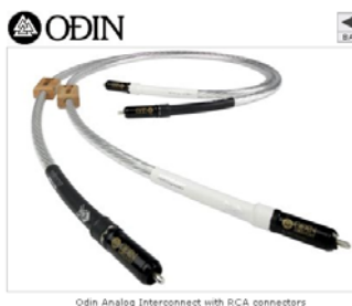
Odin Analog Interconnect with RCA connectors

Diese patentierte Technologie bietet eine noch bessere Performance als die Micro-Monofilament-Technologie. Hierbei werden zwei – dünnere – Micro-Monofilamentfäden miteinander verdrillt und sodann, wie bei der Micro-Monofilament-Technologie , in einer hochpräzisen Spiralförmigkeit um den einzelnen Leiter gewunden. Das Resultat ist, daß der Leiter zu einem noch größeren Teil von Luft umgeben ist und als Folge der Kontakt des Leiters mit der Isolierung um mehr als 85% verringert werden kann. Diese einzigartige Konstruktion bietet eine noch größere Bandbreite, noch schnelleren Signaltransfer und überragende Musikalität .