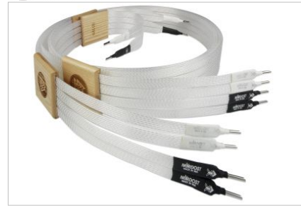
Odin Supreme Reference Speaker Cable with Bi-Wire terminations

nah an die theoretische Leistungsfähigkeit eines massiven Kupferrohres heranzureichen, ohne die Nachteile der mechanischen Unflexibilität in Kauf zu nehmen, die solch massive Konstruktionen unweigerlich mit sich bringen.