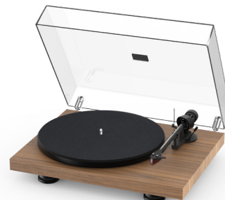
Satin Echtholz Walnuss Furnier