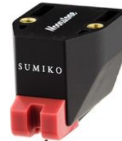
Ersatznadel Moonstone UVP 270,00 €