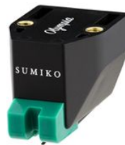
Ersatznadel Olympia UVP 155,00 €